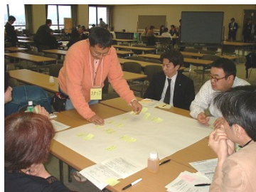
姫路の顔づくりフォーラム、グループワークの様子

ひめま☆さろんは毎月3回程度、水曜の午前に開催しています。スローライフ講座も、月に2~3回程度開催しています。また、姫路駅周辺整備に関する市民参加のまちづくりに向けて、HOTシャッタープロジェクトを立ち上げており、これから市民の皆さんに参加を呼びかけて行くことになります。詳細はHPやメールなどでお知らせしますので、情報をご希望される方はメール(slowoffice@memenet.or.jp)でご連絡ください。