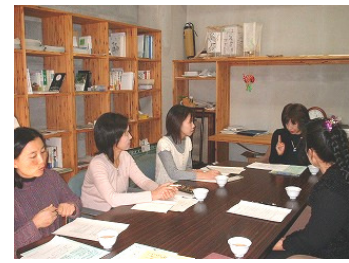
ひめま☆さろんの活動風景

経済性や効率性が優先される現代社会の中、多様なつながりが失われつつある中、人と人のつながり、自然や未来の地球とのつながりを紡ぎ直すことを目的に活動しています。実際にやっている活動としては、スローライフを推進するためのスローライフ講座や子育てママの自分育てさろん(ひめま☆さろん)、姫路の顔である姫路駅から姫路域にかけてのまちづくりに市民が関わる場づくりなどの活動をすすめています。ひめま☆さろんやスローライフ講座では、1才~就学前の子どもの託児サービスをしています。小さな子どものいるお母さんも、参加しやすくなっています。また、スローライフ講座ではスローな食についての調理実習もあり、それを通じて食の安全、地産地消などへの意識が高まっていると感じています。参加されるお母さんたちからは、「自分が積極的になった」、「世界が広がった」、「子育てが楽しくなった」、という声を聞いています。