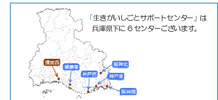
「生きがいしごとサポートセンター」は兵庫県下に6センターございます。