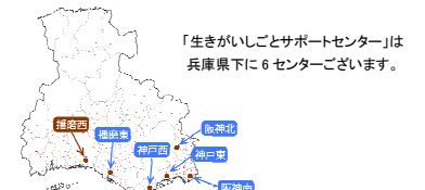
「生きがいごとサポートセンター」は兵庫県下に6センターございます。

NPO 法人コムサロン21 は、 ・人的ネットワークの構築 ・ソーシャルビジネスやコミュニティビジネスの起業支援 ・行政・企業・地域団体・NPO 等様々な団体との協働 等、様々な活動を行っています。